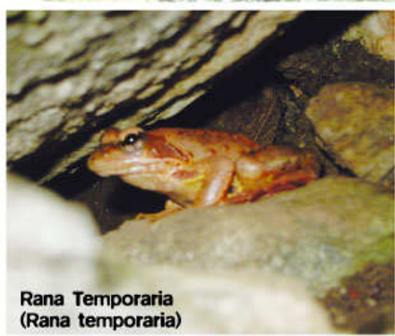
Rana Temporaria (Rana temporaria)