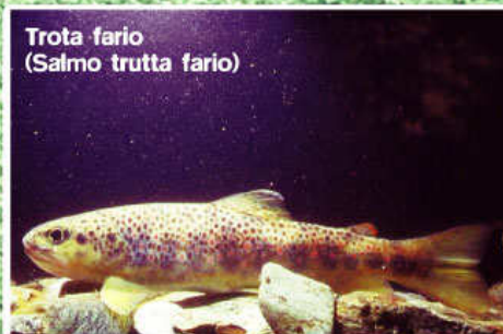
Trotta fario (Salmo trutta fario)