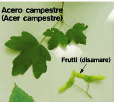
Acer campestre (Acer campestre)