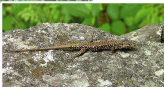
Lucertola muralola ( Podarcis muralis )