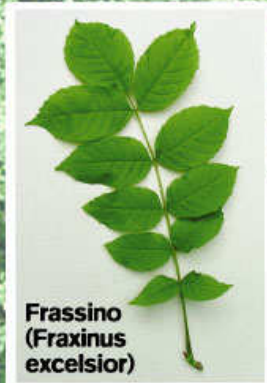
Frassino (Fraxinus excelsior)