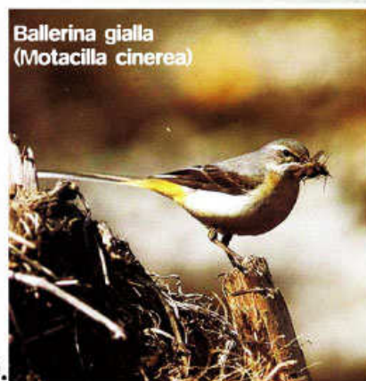
Ballerina gialla (Motacilla cinerea)

ed il Merlo acquaiolo. Oltre a questi, è possibile ascoltare, lungo il sentiero, anche il canto di: Cinciallegra, Pettirosso, Scricciolo, Fringuello, Capinera, Merlo, Corvo, Picchio nero e Picchio muratore.