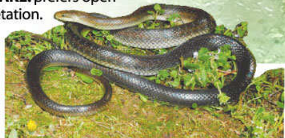
Saettone ( Elaphe longissima )