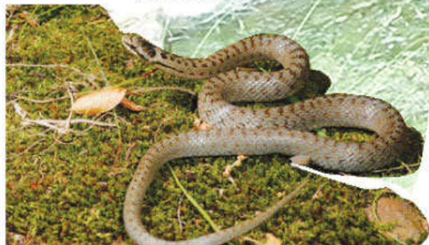
Colubro liscio ( Coronella austriaca )