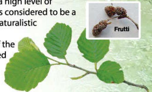
Ontano bianco (Alnus incana)