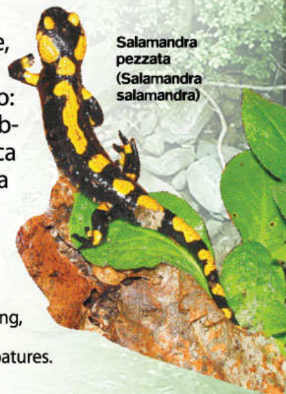
Salamandra pezzata (Salamandra salamandra)

tipica dei boschi di latifoglie, la sua colorazione brillante ha funzione di avvertimento: essa è infatti protetta dall'abbondante secrezione tossica delle ghiandole che irrita la bocca e gli occhi dei predatori.