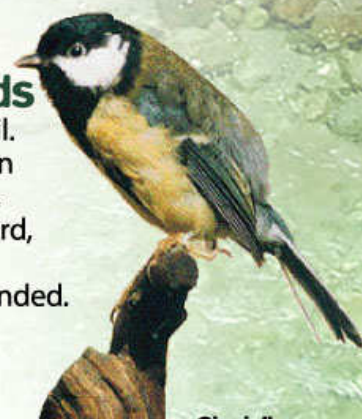
Cinciallegra (Parus major)

The use of binoculars is recommended. The Segnara Valley is inserted in the Important Bird Area of "Ossola Valley".