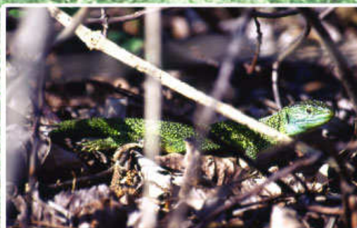
Ramarro occidentale ( Lacerta viridis )

Predilige habitat aperti con chiazze di vegetazione arborea ed arbustiva, preferibilmente con presenza di muretti a secco. Queste specie sono RIGOROSAMENTE PROTETTE