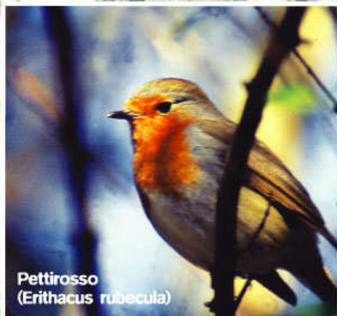
Pettirosso (Erithacus rubecula)

osservazioni è consigliato l'uso del binocolo. La Valle Segnara è inserita nell'Important Bird Area Val d'Ossola".