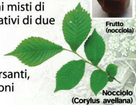
Nocciolo (Corylus avellana)