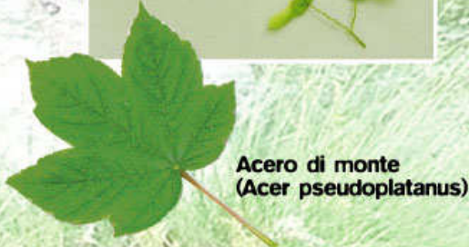
Acer di monte (Acer pseudoplatanus)