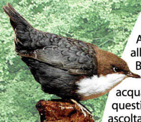
Merlo acquaiolo (Cinclus cinclus)

Durante l'escursione, la vista e l'udito saranno i sensi coinvolti maggiormente: i canti di numerose specie di Uccelli vi accompagneranno durante tutto il percorso. Alcuni volatili sono particolarmente legati alla presenza di acqua, come la